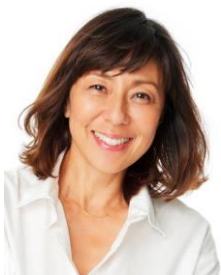
タレント/ファッションディレクター/ビューティースーパーフードマイスター RIKACO